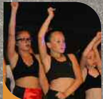
Fresnes Asso - p.7