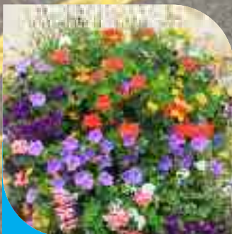
Fresnes News - p.3