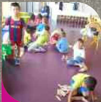
Fresnes Enfance Jeunesse - p.6